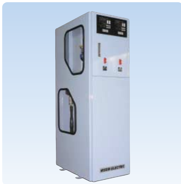
7.2kV超縮小形スイッチギヤ「XAE. 6」

名 称：2006電設工業展製品コンクール 「関西電力株式会社社長奨励賞」 受 賞 製 品：7.2kV超縮小形スイッチギヤ「XAE. 6」