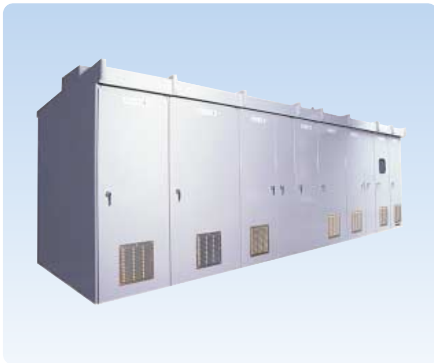
高圧・大容量コンデンサ型瞬低対策装置「メガセーフ」