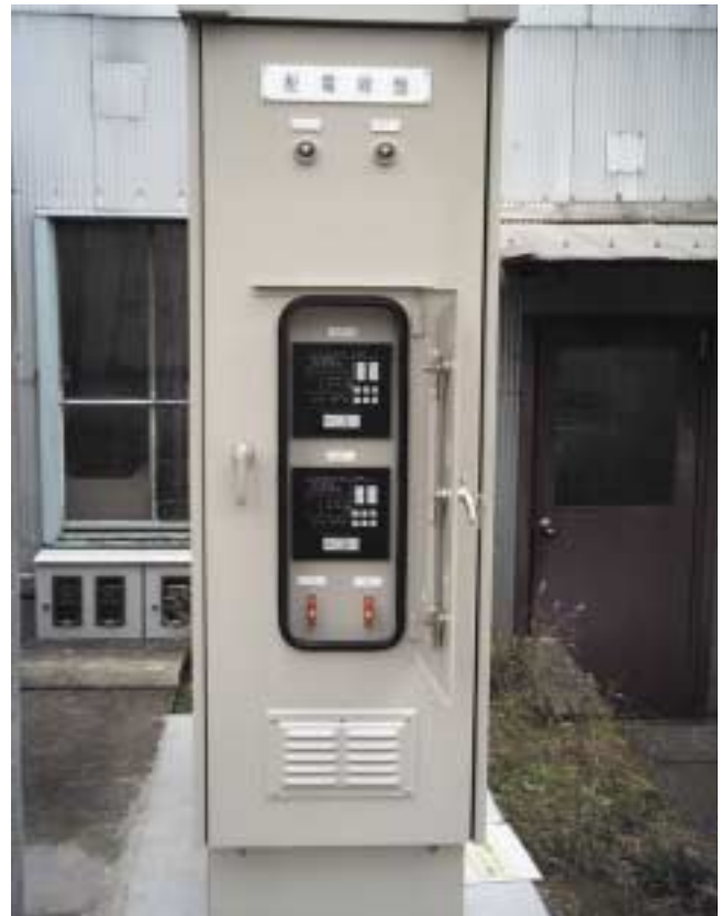
図2 社内フィールド試験実施状況