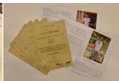
タイ中学生からの近況報告(3)