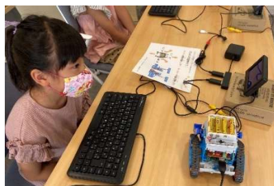
プログラミング体験教室(4)