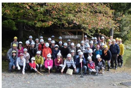
京都の森 看板前での集合写真 (2019 年撮影) (1)