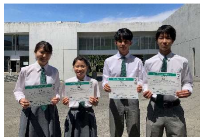
GEC2022 日本代表チーム (湘南藤沢高) (5)