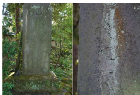
無鄰庵庭園の「恩賜稚松の記」石碑(2)