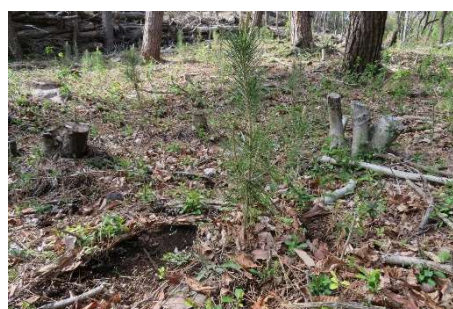
赤城県有林で元気に成長するクロマツ(2)