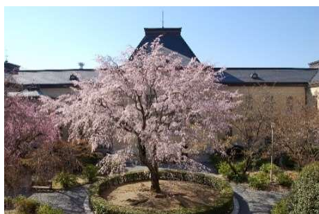
京都府庁旧本館中庭のしだれ桜(1)