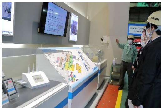
技術交流会での工場見学の様子

2021 年 12 月には、希望者による「技術交流会」を開催し、日新電機の工場見学や社員との対面での交流を行いました。また、2022 年 2 月には、全ての奨学生が研究報告を通じて交流を行う「奨学生交流会」をオンラインにて開催しました。