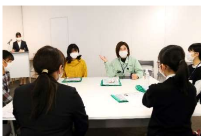
京都 STEAM 女子応援セミナー(1)