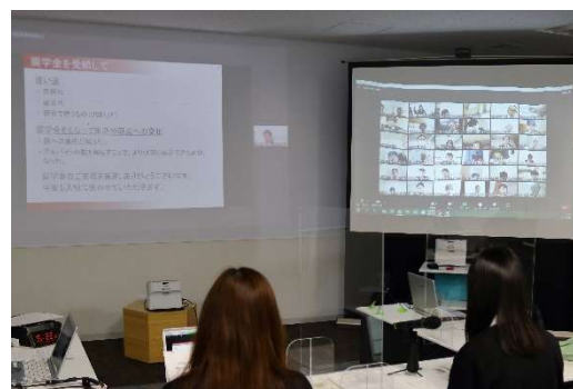
オンライン奨学生交流会の様子