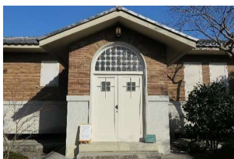
岩倉具視幽棲旧宅の対岳文庫(3)