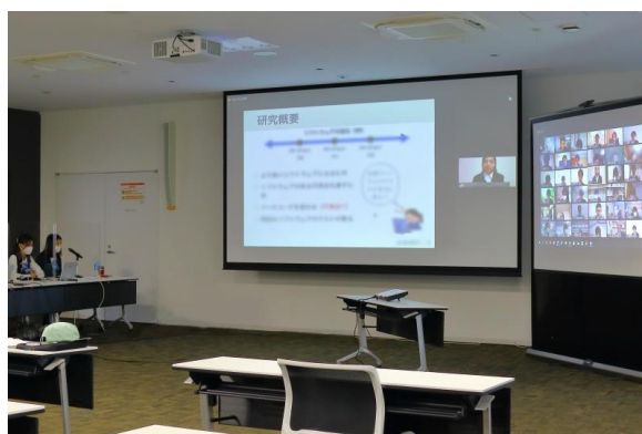
オンライン奨学生交流会の様子

また、奨学生が研究報告を通じて交流を行う「奨学生交流会」をオンラインにて2021年2月に開催しました。