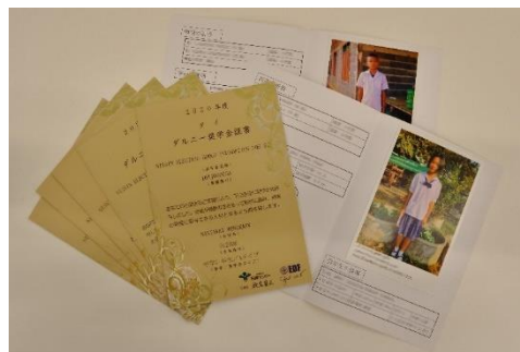
タイの中学生からの近況報告