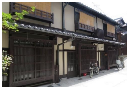
京町家(五条坂なかにわ路地)