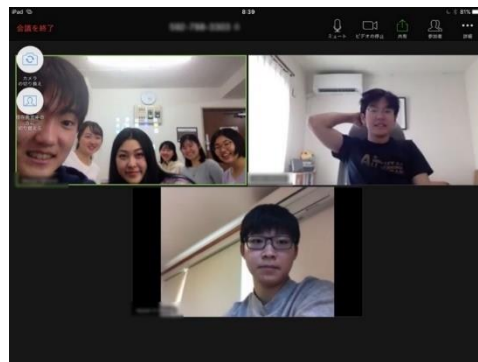
ビジネスアイデアの国際競技 2020 年世界大会出場チーム(日本)