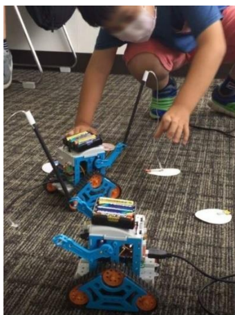
こども向けプログラミング体験教室